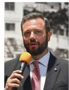
Il parlamentare Mirco Carloni

Di fatto una condivisione su Carloni è già stata espressa in maniera ufficiosa e questo sarà il nome portato alle Commissioni di Camera e Senato per la ratifica dell'incarico. È probabile, a questo punto, che la presidenza dell'Abruzzo possa chiedere e facilmente ottenere un suo candidato di fiducia per il ruolo di Segretario dell'Adsp, il numero