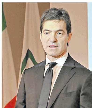
Il governatore Francesco Acquaroli e la sua posizione sul dibattito in merito alla necessità di federare (se non proprio fondere) le quattro università delle Marche

ANCONA Confindustria almeno ci prova. I magnifici rettori delle nostre università hanno invece sbattuto la porta in faccia all'ipotesi di una federazione dei quattro Atenei formato puffo che la new entry Quagliarini (da novembre alla guida della Politecnica delle Marche) ha osato avanzare. «Giammai, evviva l'autonomia», si sono affrettati a vergare dispacchi. Con buona pace della logica del fare squadra per vincere le sfide di un mondo che cambia. Un sussulto di coraggio arriva tuttavia - a sorpresa - dalla politica. E non dalle terze file (quelli che in privato sono per la fusione, ma poi i voti devono andarli a chiedere pure a Camerino, Macerata e Urbino, quindi meglio non dire niente e via di cerchiobottismo), ma dal Lider Máximo (non si offenda per l'accostamento alla sinistra estrema) Francesco Acquaroli.