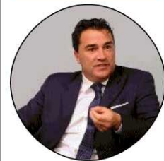
Il presidente dorico «Via le vecchie logiche»

«La dimensione provinciale resta fondamentale per il presidio territoriale, ma oggi è necessario rafforzare la capacità di azione del sistema. Solo un sistema più integrato può sviluppare servizi avanzati».